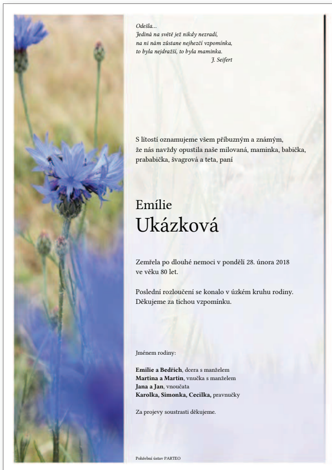
Linie pozadí 3