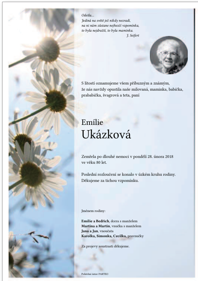
Linie pozadí 2