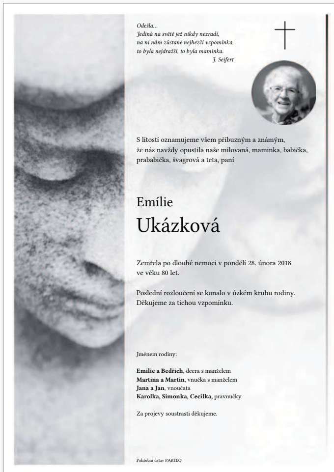
Linie pozadí 1