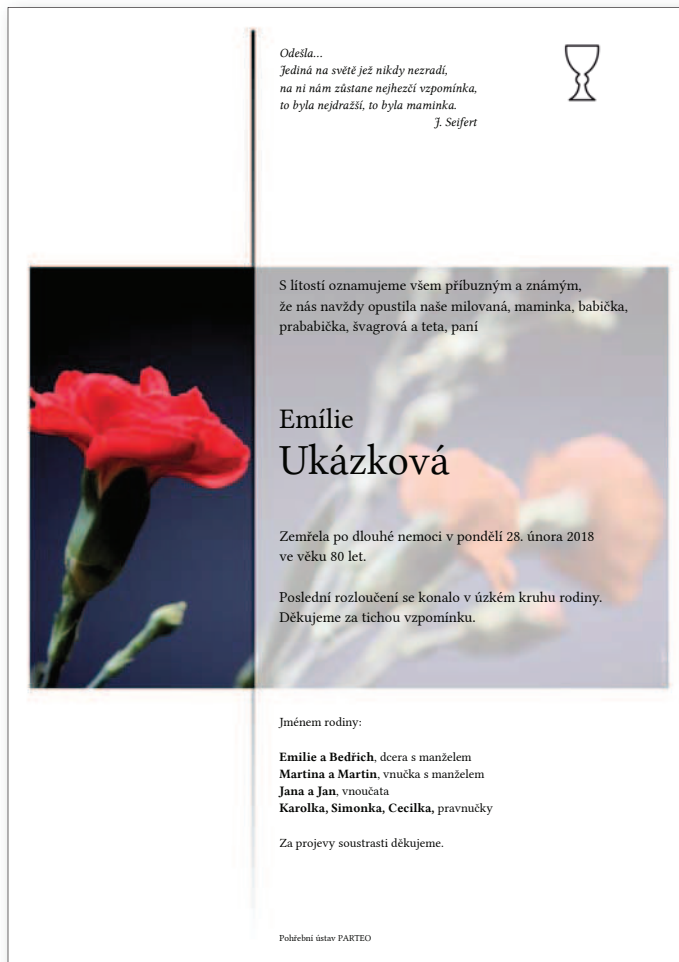
Linie pozadí 4